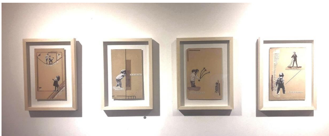
Figura 7.- Colectivo Los de acá, Exposición en el Centro de Arte de la Universidad de la Plata, Argentina, 2018.

En esta serie de obras apelativa del recuerdo y la memoria, el nuevo contrato narrativo a partir de esas imágenes ajadas y amarillentas se inaugura en la retórica de evocación que las reúne en composiciones con objetos insignificantes (hilos, broches, cuentas, puntillas, flores de tela, botones ligados al vestuario, especialmente femenino) nacidos para funcionar, decorar y servir, pero destinados a ser olvidados o desechados en el fondo de un cajón y que –sin embargo– son capaces de disparar el recuerdo. Pequeños objetos ligados a la noción antigua de lo femenino, la niñez (Figura 9) y el matrimonio. Parfraseando a Octavio Paz (1989), monumentos de momentos hechos con desechos de cada momento; fragmentos mínimos en ruinas, hechos creaciones; olvidados por no pensados y por no nombrados.