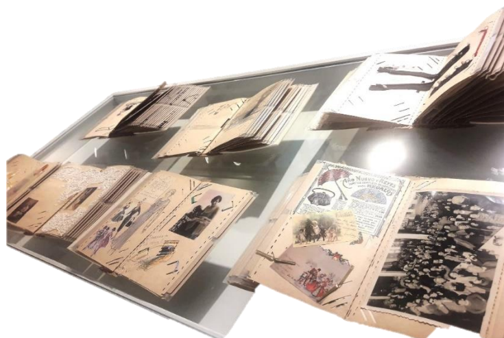
Figura 6.- Colectivo Los de acá, Exposición en el Centro de Arte de la Universidad de la Plata, Argentina, 2018.

Estos objetos fetichizados, por consiguiente, no son accesorios, ni tampoco signos culturales entre muchos otros: simbolizan una trascendencia interior, el fantasma de un meollo de realidad en el que vive la conciencia mitológica, toda conciencia individual; fantasma de la proyección de un detalle que sea equivalente del yo alrededor del cual se organiza el resto del mundo (Baudrillard, 1969, p.90)