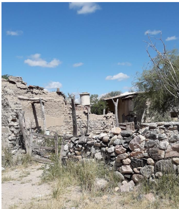
Figura 1. – Ruinas de la casa de la familia Vera Peñaloza, 200 años de antigüedad, Malanzán, La Rioja, Argentina, 2023, Foto de autor.

La ruina puede ser objeto de estudio y teorización desde puntos de vista antropológicos, arqueológicos, históricos, psicológicos, estéticos y artísticos, últimos dos aspectos que nos convocan en este artículo. Todos esos campos de saber se intersecan y forman un entramado conceptual que enriquecen y alimentan mutuamente, condensables en el ámbito de la Estética de la Ruina y de la Ruinología. La primera es el estudio filosófico acerca de la concepción y devenir artístico de la ruina abarcando las dimensiones antropológicas, sociológicas e históricas de su estudio y su origen, estar, ser y permanecer como tal, pero también como símil retórico y metafísico en referencia al derrumbe de las culturas, sociedades o al desmoronamiento del individuo. La segunda disciplina se desarrolla como revisitación del pasado para estudiar las culturas a través de sus vestigios. Si bien ambos campos nacieron a partir del estudio de la ruina arquitectónica, en su desarrollo contemporáneo toman el concepto de ruina ambigüado 2 y amplio. Ambas disciplinas han aportado teorizaciones y caracterizaciones originalmente referidas al estudio de ruinas arquitectónicas a otro tipo de ruina, las portátiles; a la vez, el trabajo artístico