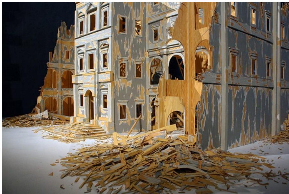
Figura 4.- Antonio Fernández Alvira, La dernière lueur (detalle), Exposición en la Chapelle des Calvariennes, Francia, 2016. Fotos del artista.

arquitecturas en ruinas, producidas o reproducidas en pequeña escala o a escala humana por medio de artificios tales como el trompe l'oeil 6 simulando la calidad, textura y contextura de los materiales a través del dibujo y la acuarela sobre papel en montajes de maquetas constructivas escultóricas-escenográficas (Figura 6). Se trata de una colección de ruinas artificiales en las que el artista selecciona símbolos del poder monumentalizado arquitectónicamente y los presenta aún reconocibles, pero destruidos, en un modo metafórico de manifestar su fragilidad, vulnerabilidad y la reductibilidad de las obras humanas al punto de los desechos. No hay aquí necesariamente una ruina real transpuesta a otro lenguaje, pero la ruina arquitectónica es transformada en un objeto portable, escultórico en este caso. Estas construcciones e instalaciones están teatralmente iluminadas, recortadas dentro de un lóbrego espacio circundante en penumbras. No son obras aisladas, sino que conforman una serie y por lo tanto las referencias previas han sido seleccionadas y coleccionadas en base a tres conceptos: poder, fragilidad, ruina en un recorrido que enlaza todos los trabajos de las muestras seleccionadas