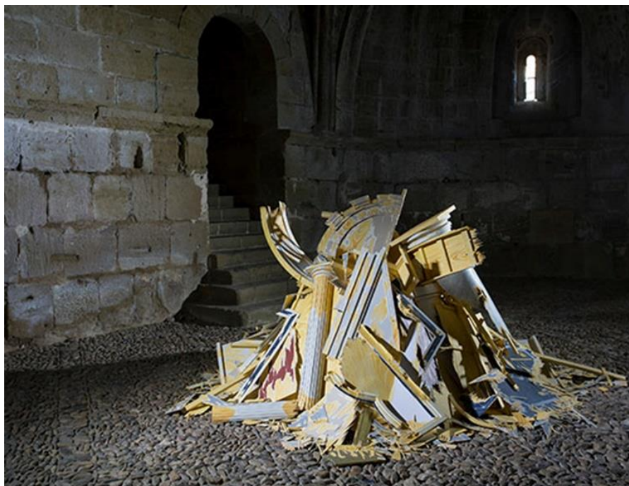
Figura 5.- Antonio Fernández Alvirá, La leyenda del imaginario, Exposición en el Museo de Huesca, España, 2016. Fotos del artista.

El artista no realiza estudios o representaciones románticas de la ruina, sino que el sentido es claramente político y metafísico. Todo aquello que parece destinado a durar también es efímero y aun así puede trascendernos. Las heridas de las superficies y volúmenes arquitectónicos, son imitadas; los desplomes, forzados a ser; los derrumbes y acumulación de escombros (figura 7), un simulacro: todo artificio del dispositivo que se crea para ponerle voz a un pre-texto desde el arte.