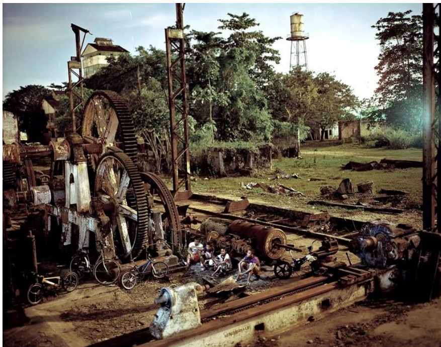
Figura 3.- Alejandro Chaskielberg, Surinam Agridulce, 2011 (serie).

Portugal, y el paisaje de una Sudamérica selvática y tropical; una historia, rasgos de las comunidades y una geografía que generan incertidumbre y ambigüedad en la imagen del ambiente. Juega compositivamente siempre con la retórica de sinécdoque y asíndeton. Cada uno de los restos retratados refiere a un todo lejano y difícil de recomponer mediante el relato. Las ruinas, restos y desechos viven su olvido dispersas y separadas unas de otras, pero el recorrido entre esos nodos se hace procedimiento, y los nexos entre ellas desaparecen recomponiéndose en el relato poetizado de la serie ya sea en la muestra, en el libro o en la web del artista. La ruina se destaca y despeja del ambiente a través de la iluminación creándose una fantasmagoría del pasado. Cada tanto, la presencia humana de grupos, le agrega mayor ambigüedad a la imagen, especialmente a su escala: ¿se trata de escalas reales o montajes hiperbólicos? (Figura 5). La ruina ya nos atrapó y como material de obra se reedita en su segunda oportunidad.