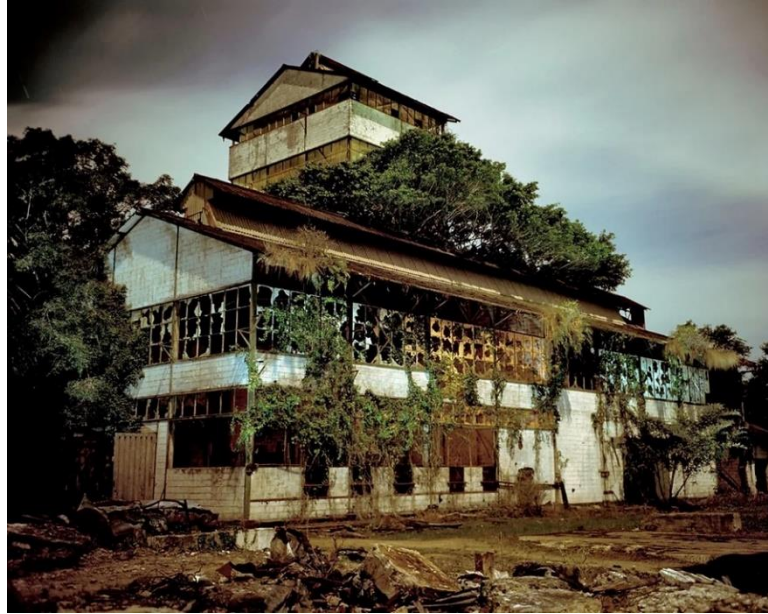
Figura 2. Alejandro Chaskielberg, Surinam Agridulce, 2011 (serie).