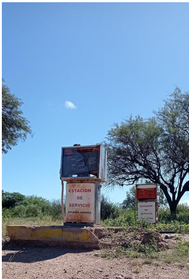
Figura 1. - Ruinas de la Estación de Servicio de Solca, La Rioja, Argentina, 2023.

Ruinas y restos procedentes de un pasado que ha sido de alguna manera, sacralizado, tienen posibilidades de validación cultural e histórica, mientras que ruinas de ignota procedencia, localizadas en lugares poco accesibles o consideradas intrascendentes son sometidas a procesos de omisión, cancelación o inacción (Figura 2): objetos exiliados del relato hegemónico, objetos ruinosos del ámbito de lo cotidiano, que no trascienden a la esfera de lo mediatizado o patrimonial, pero han sido parte de la cultura popular. Convocados a una colección especial a partir de su propia invisibilidad, olvido, ruina y a la desidia o el abandono al que han sido sometidos son terreno de libre de acción; les queda la vandalización de sus despojos, la conquista de sus restos por los embates de la naturaleza misma, hasta –muchas veces– su completa extinción: la transformación en una ruina definida como escatológica 3 . Son restos que no permiten una connotación hacia el todo original;